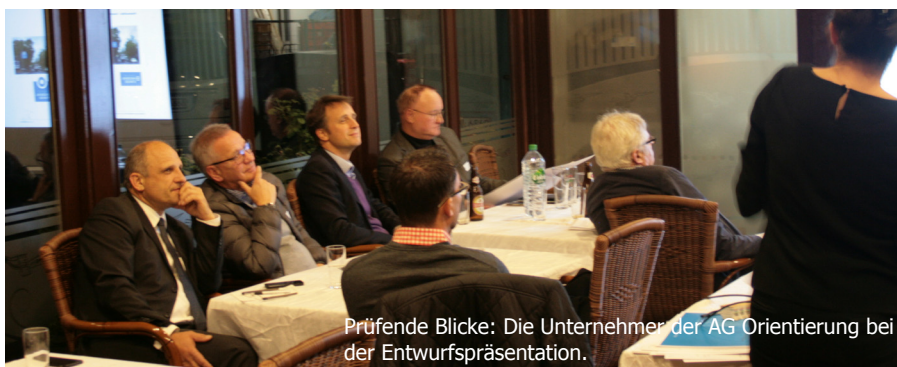
Prüfende Blicke: Die Unternehmen der AG Orientierung bei der Entwurfspräsentation.

In einem nächsten Schritt sollen Anwendungen für das neue Logo umgesetzt werden: Der Bezirk wird Hinweisschilder an den Eingängen zum Gewerbegebiet aufstellen. Unternehmen können Tafeln in dem neuen Design auf ihrem Firmengelände aufstellen, andere mögliche Anwendungen sind Flaggen oder Leuchtkästen mit dem feuerroten Logo. Bei Interesse wenden Sie sich an das Gebietsmanagement oder das Büro für Wirtschaftsförderung.